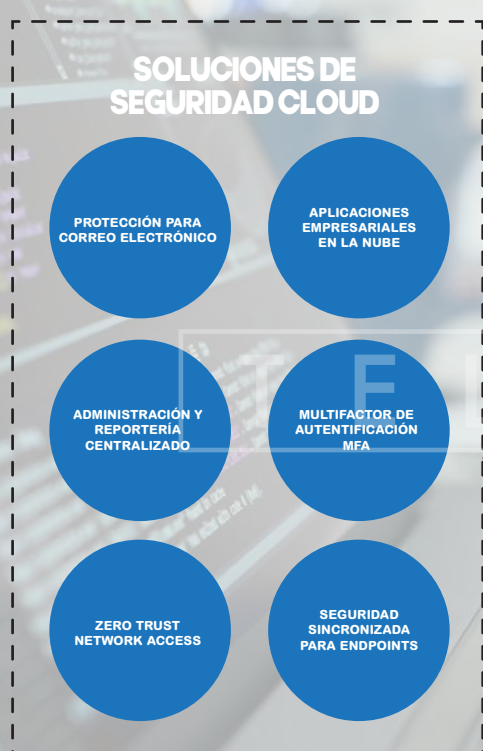
DIAGRAMA DE SOLUCIONES

10 SEGURIDAD ESPECÍFICA PARA DISPOSITIVOS MÓVILES Y DISPOSITIVOS IOT